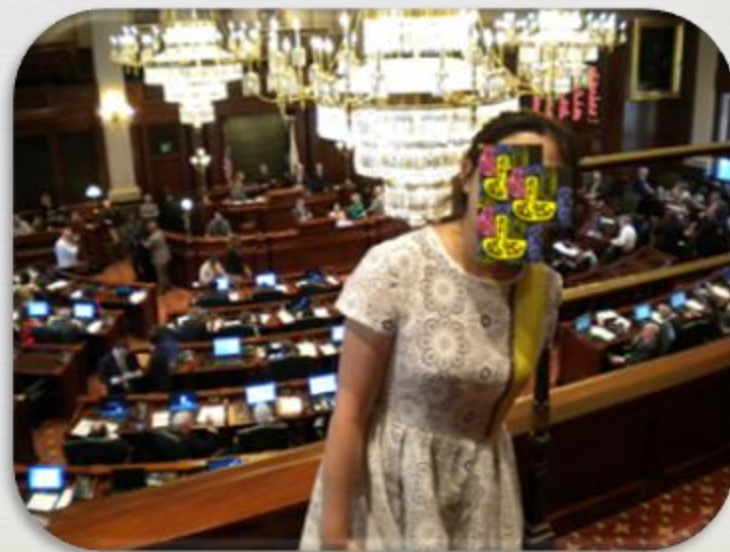
芝加哥市政议会厅