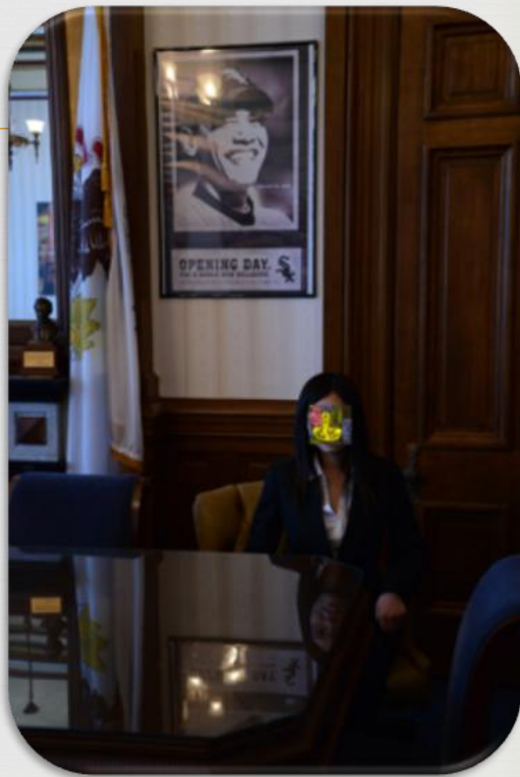
伊利诺伊州参议院办公室